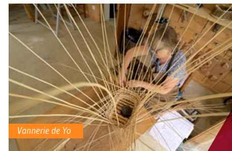
Vannerie de Yo