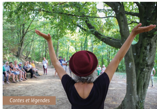
Contes et légendes