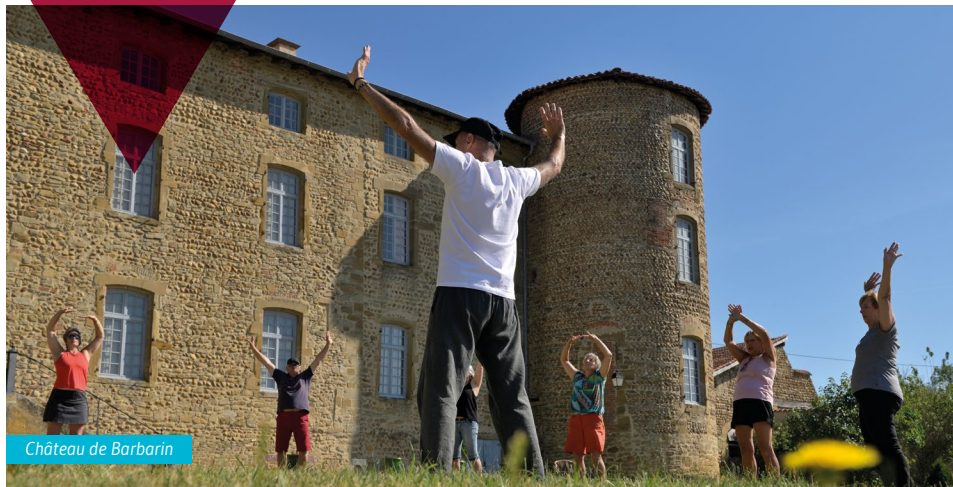
Château de Barbarin