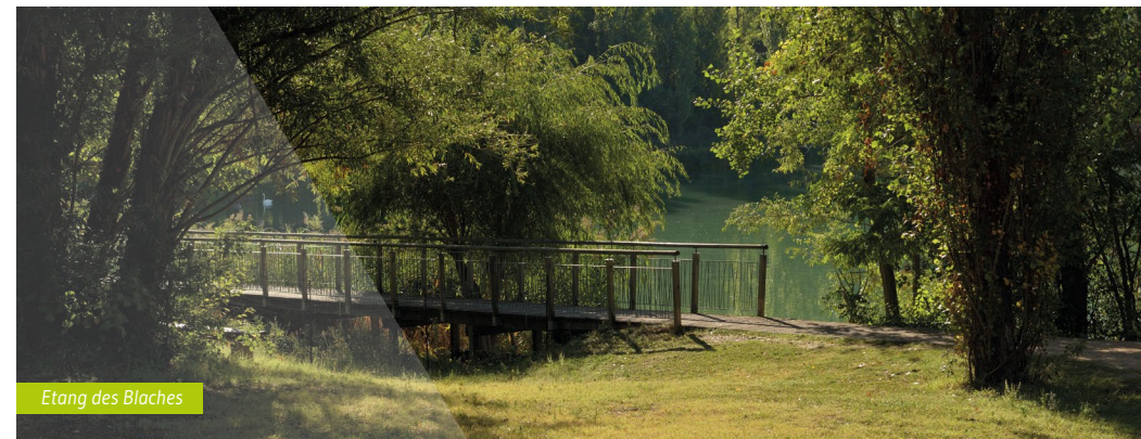
Étang des Blaches