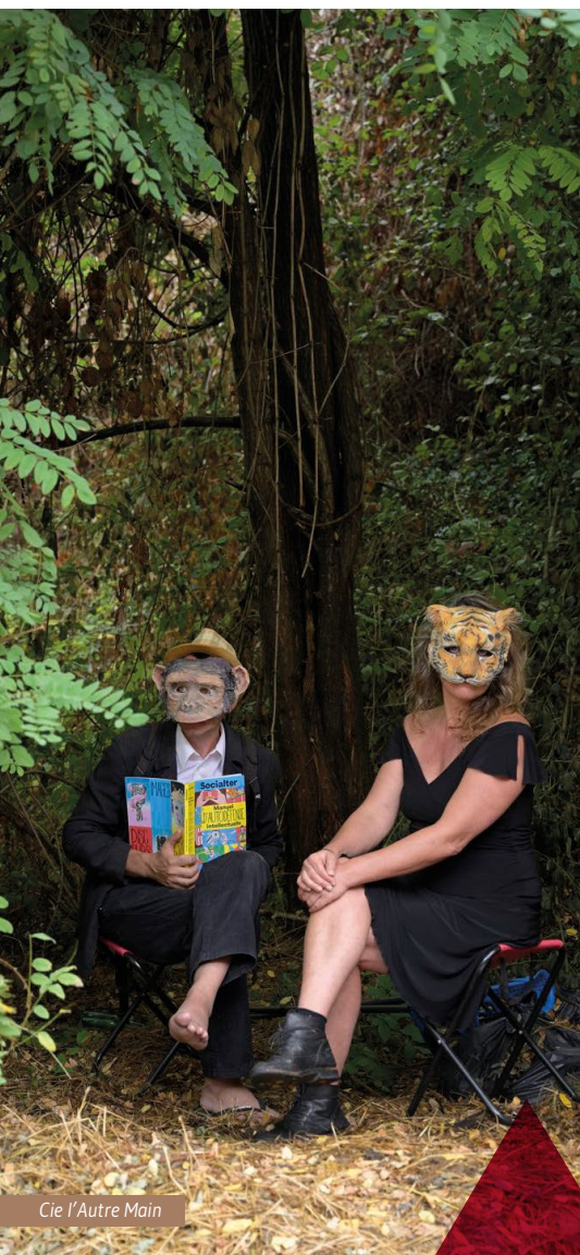
Cie l'Autre Main