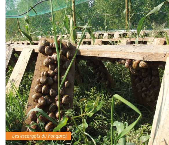
Les escargots du Fongarot