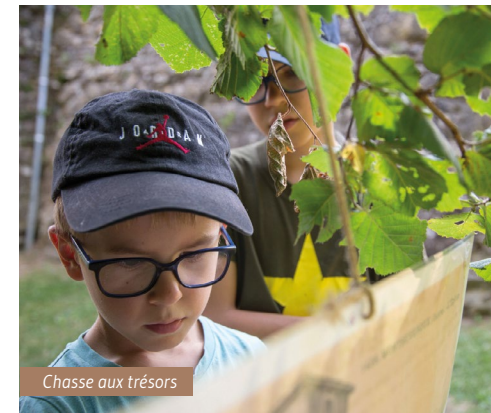
Chasse aux trésors