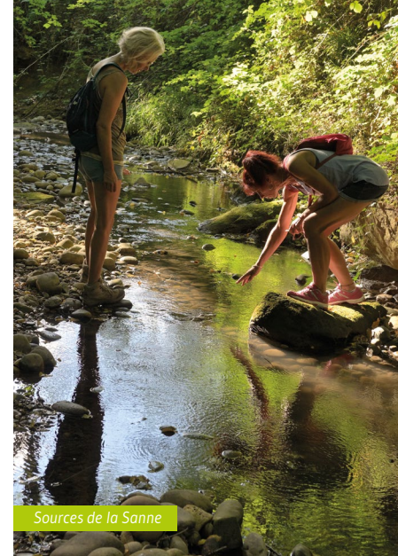
Sources de la Sanne